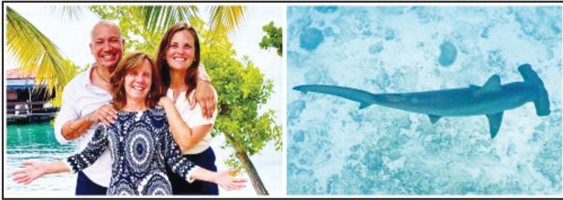
Di dos den seis siman

huntu, investigashon, por sostenibilidat di ekosiste- hasi impakto riba e salí i manan marino.